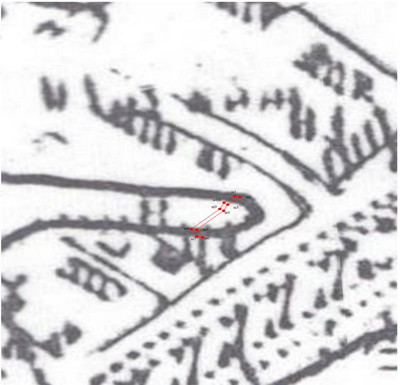
M 1: 1000